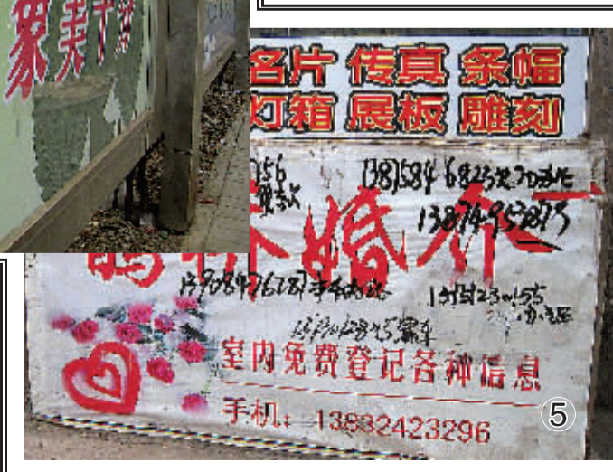
①南营子大街的乞丐屡见不鲜。 ②③⑤城市靓丽的灯箱不是被破坏就是“癣迹”斑斑。 ④丽水家园旁边桥上的路灯全遭破坏。